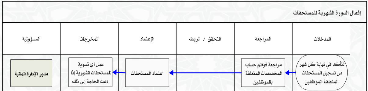
شكل رقم / ٥

يوضح المخطط البياني التالي ( شكل رقم/٥) طريقة تسلسل العمل لإقفال الدورة الشهرية للمستحقات: